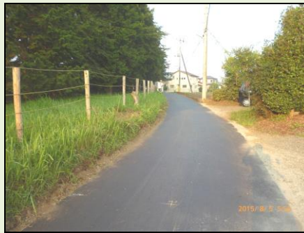
平柳地区舗装の打ち換え