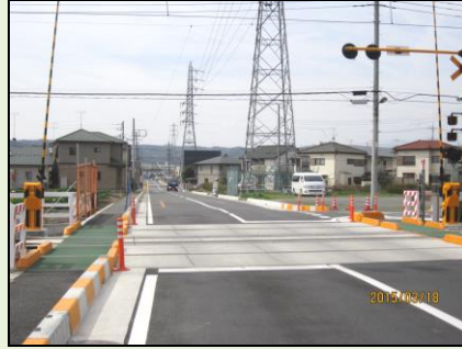
川寺地区の新踏切完成