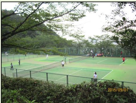
美杉台のテニス場にトイレ設置