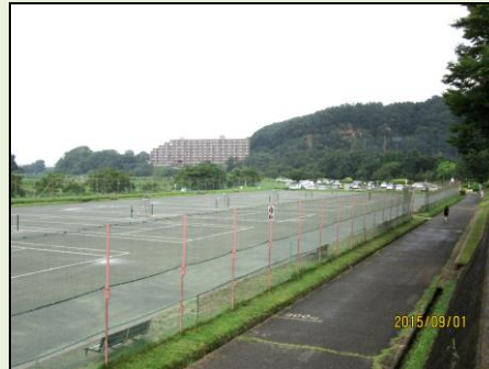
阿須と岩沢の運動公園にトイレ設置