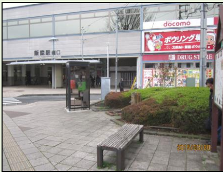
飯能駅南口と多峯主山に 観光トイレ (平成28年2月完成予定)