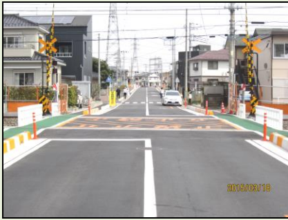
笠縫地区の新踏切完成