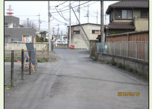
笠縫区画整理道路の整備