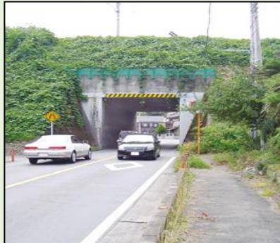
阿須ガードの拡幅